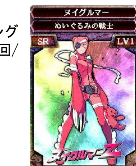
SR 指揮官「ヌイグルマー」 ※イメージ

第1回/第2回、各応募期間終了後、当選者の「キングダムコンクエスト2」アプリ内のプレゼントボックスにお送りします。