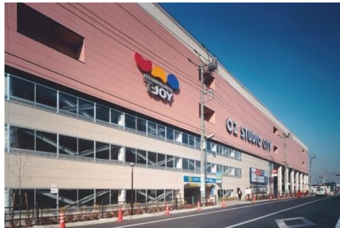
オズスタジオシティ外観